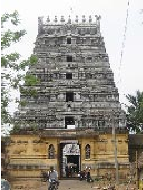
எழுத்தறிநாதேஸ்வரர் திருக்கோயில் இன்னம்பூர்